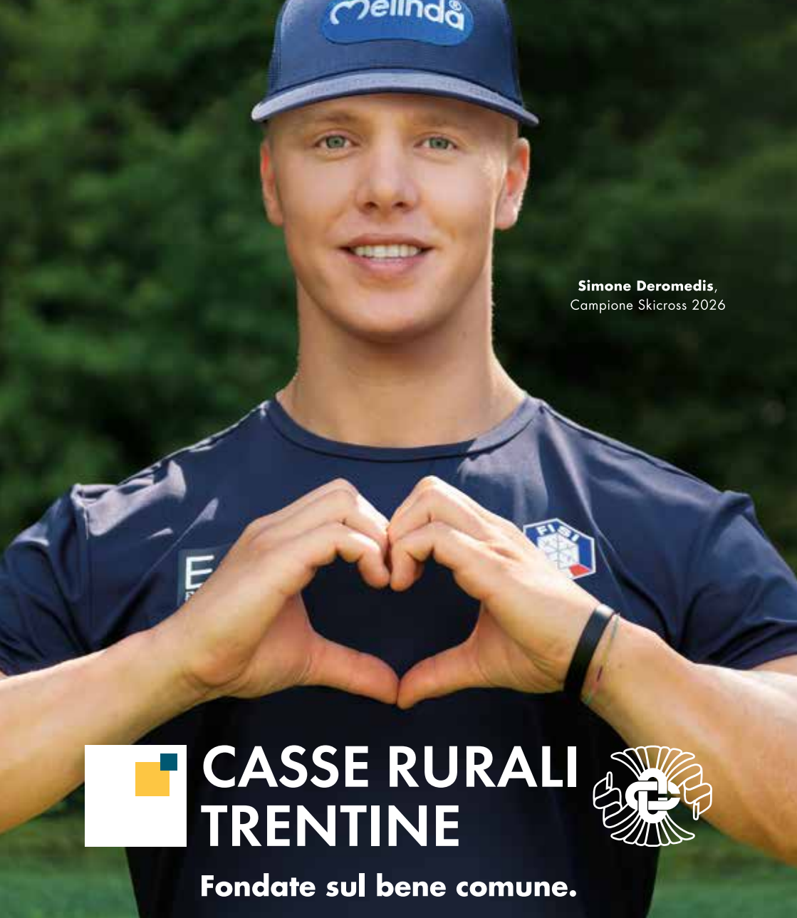
Simone Deromedis, Campione Skicross 2026